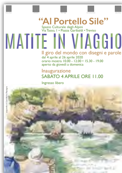
Locandina mostra Matite in Viaggio 2020