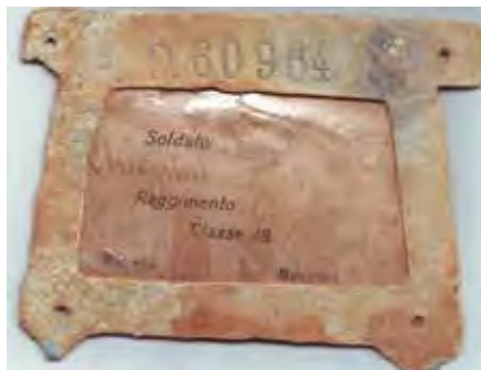
La targhetta di Chiappini Italiano.