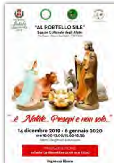
Locandina mostra Presepi realizzato con materiale bellico