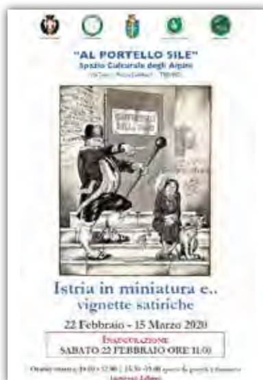
Locandina mostra Istria in miniatura