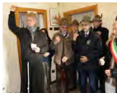
La benedizione della mostra dei presepi