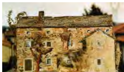
Una delle opere esposte, il rustico di Lindaro