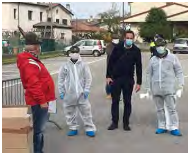
Il Sindaco Conte in visita ad una postazione

Nella lotta contro un qualsiasi pericolo esistono misure di prevenzione e misure di protezione: le prime mirano ad impedire - in realtà diminuire la probabilità - che l'evento si manifesti, le seconde a limitarne i deleteri effetti nel malaugurato caso accada quanto temuto. Già da questa grossolana definizione si capisce che le misure di prevenzione sono le prime e più efficaci da adottarsi, e senza tanto "menar il can per l'aia" nel caso dell'attuale emergenza pandemia da Covid-19 il provvedimento principe e più efficace è RESTARE A CASA al fine di evitare qualsiasi contatto o prossimità tale da espandere il contagio. Gli spostamenti sono permessi esclusivamente per i motivi noti a tutti, ma vanno fatti rispettando le precauzioni - evitare contatti, stare almeno ad un metro dagli altri, lavarsi accuratamente le mani, usare gel disinfettanti tipo Amuchina - e adoperando i dispositivi di protezione individuale (DPI) per minimizzare il rischio: guanti in lattice