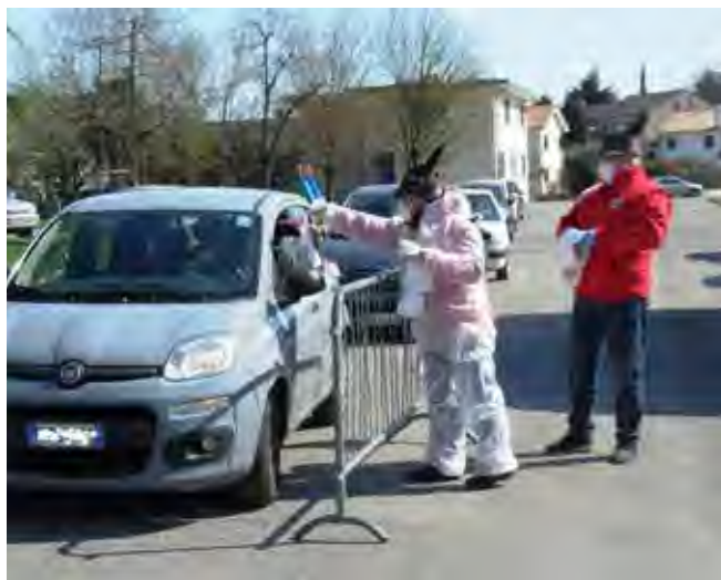
La consegna avviene da parte di alpini completamente protetti

Ma se usciamo per comprovate necessità, usiamo tutte le misure preventive