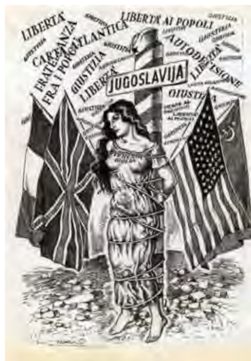
Una delle vignette satiriche di Vidris "Alla faccia della democrazia"

Informo infine che il Presidente sezionale unito al Consiglio ha nominato una commissione per programmare i lavori di manutenzione del fabbricato, che da più di vent'anni ormai accoglie le mostre e le esposizioni organizzate da quella splendida realtà culturale della nostra Sezione a tutti nota come "Portello Sile".