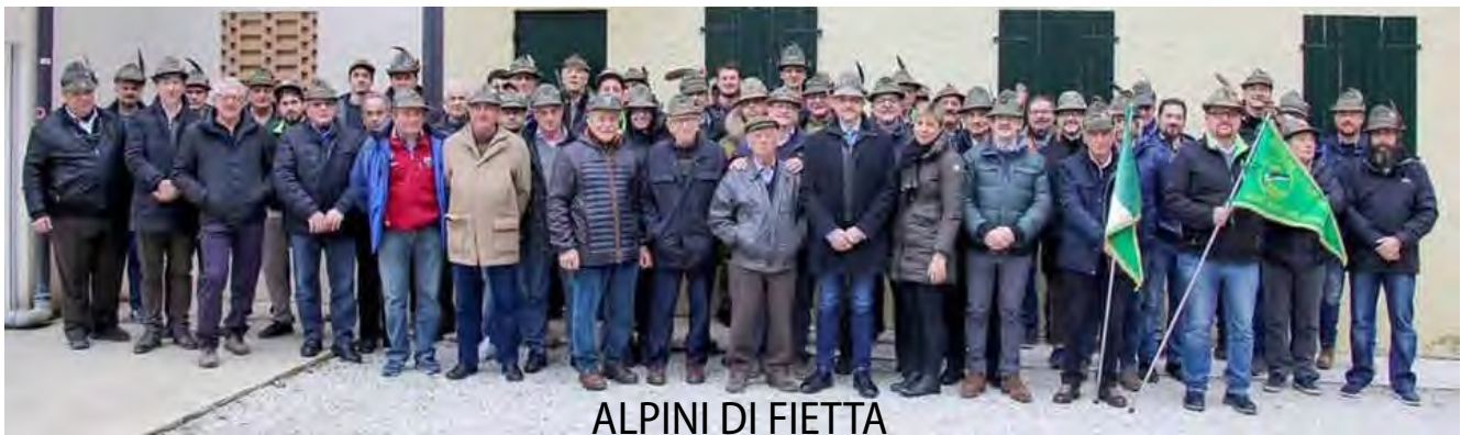
ALPINI DI FIETTA