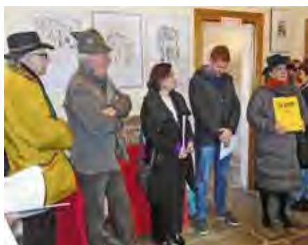
Gli ospiti raccontano la mostra "Istria in miniatura ..."