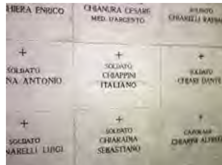
La lapide corretta (si nota la fresatura per cancellare il nome errato).