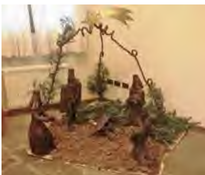
Il presepe di Sergio Pacori,